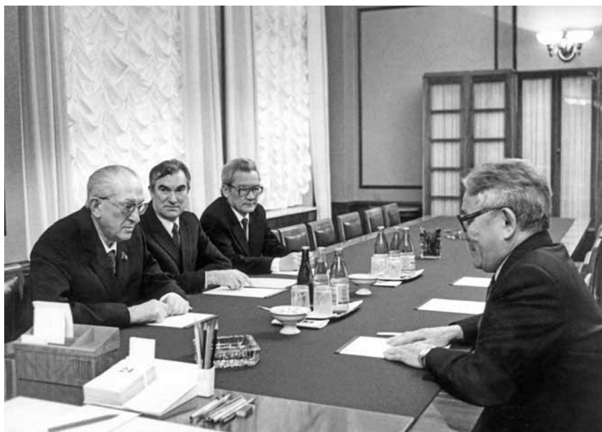
Встреча в Кремле с Генеральным секретарем ЦК Монгольской народно-революционной партии, Председателем Великого народного хурала МНР, Ю. Цеденбалом. Москва, 24 декабря 1982 г.