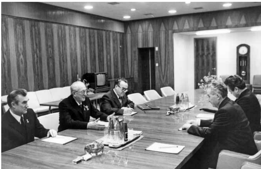
Встреча в Кремле с Генеральным секретарем ЦК Румынской Компартии, Президентом СРР Н. Чаушеску. Москва, 21 декабря 1982 г.