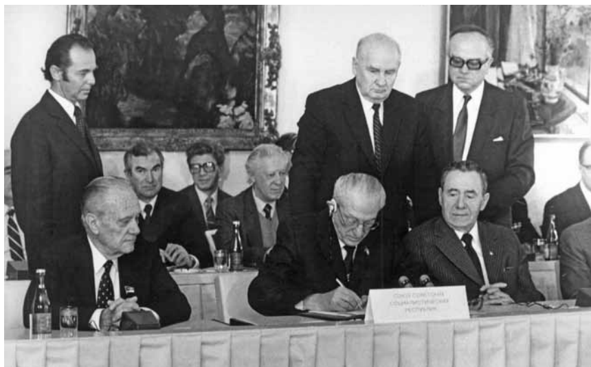
Ю. В. Андропов подписывает документы совещания ПКК. Прага, январь 1983 г.