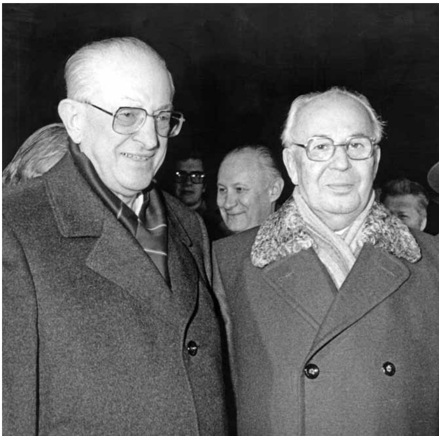
Президент Густав Гусак встречает на аэродроме Ю. В. Андропова. Прага, 4 января 1983 г.