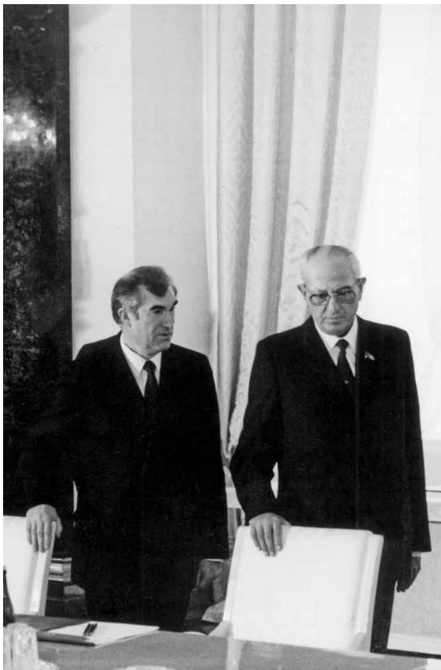
Ю. В. Андропов со своим помощником В. В. Шараповым перед встречей с зарубежной делегацией. Осень 1982 г.