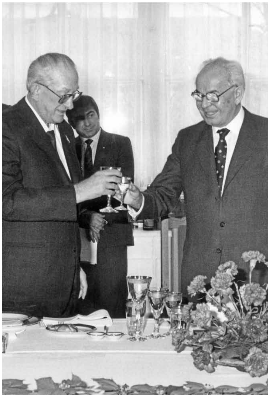
С Густавом Гусаком во время совещания ПКК. Январь, 1983 г.