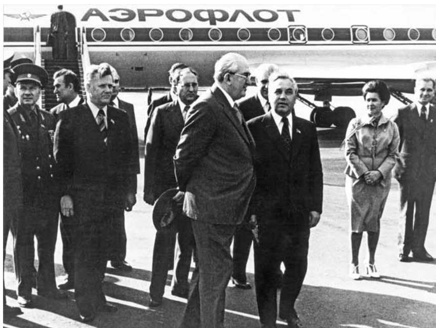
Член Политбюро Г. В. Романов встречает Ю. В. Андропова в аэропорту Ленинграда. Август 1978 г.