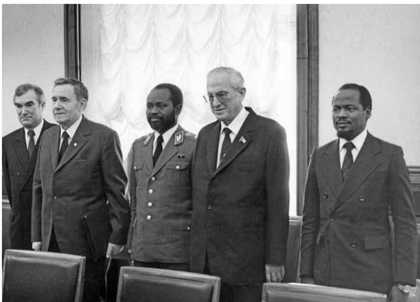
Встреча с Председателем партии Фрелимо, Президентом Народной Республики Мозамбик Саморой Машелом. Москва, Кремль, 2 марта 1983 г.