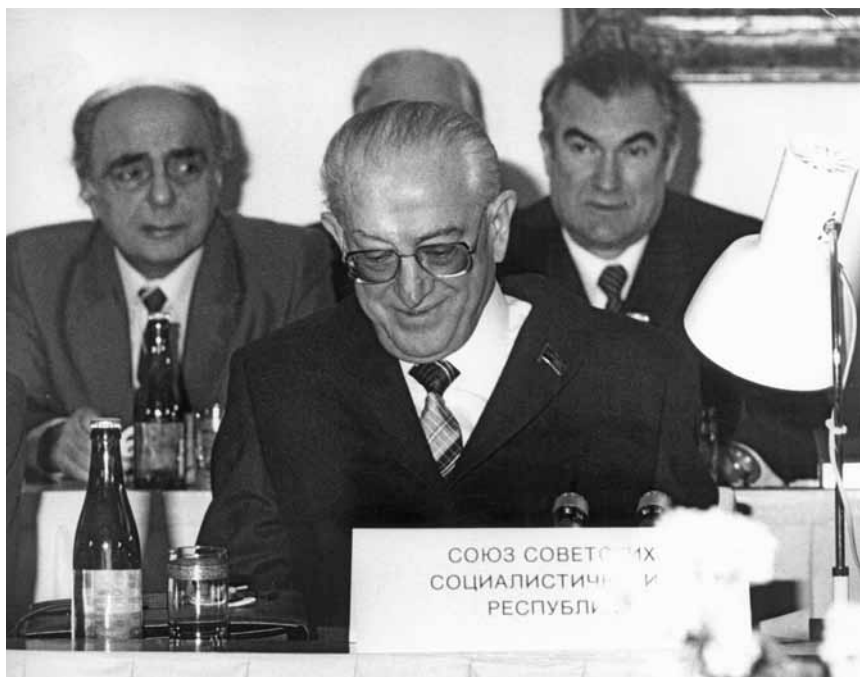
Совещание Политического Консультативного Комитета государств-участников Варшавского Договора. Прага, 4 января 1983 г.