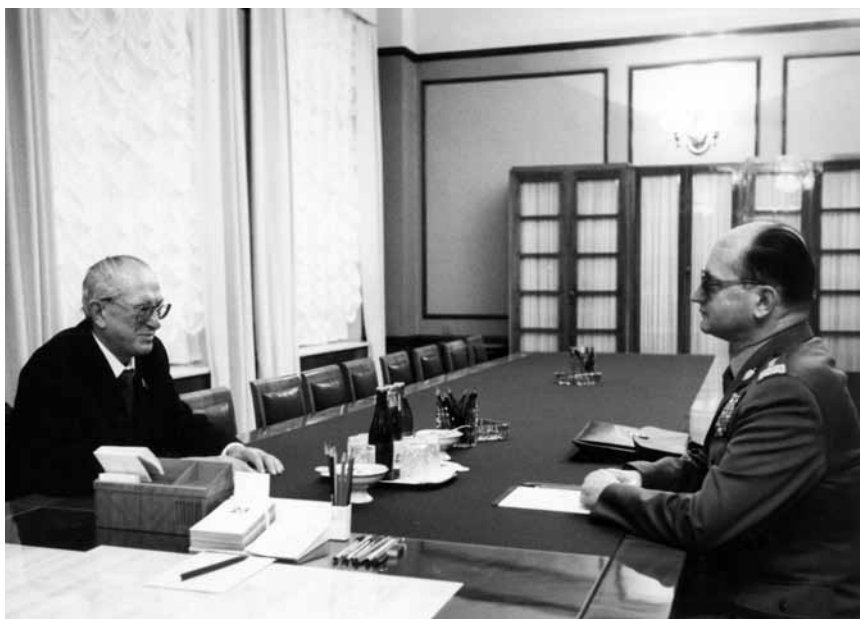
Встреча в Кремле с Первым секретарем Польской объединенной рабочей партии, Премьер-министром Польской Народной Республики В. Ярузельским. Москва, 23 декабря 1982 г.