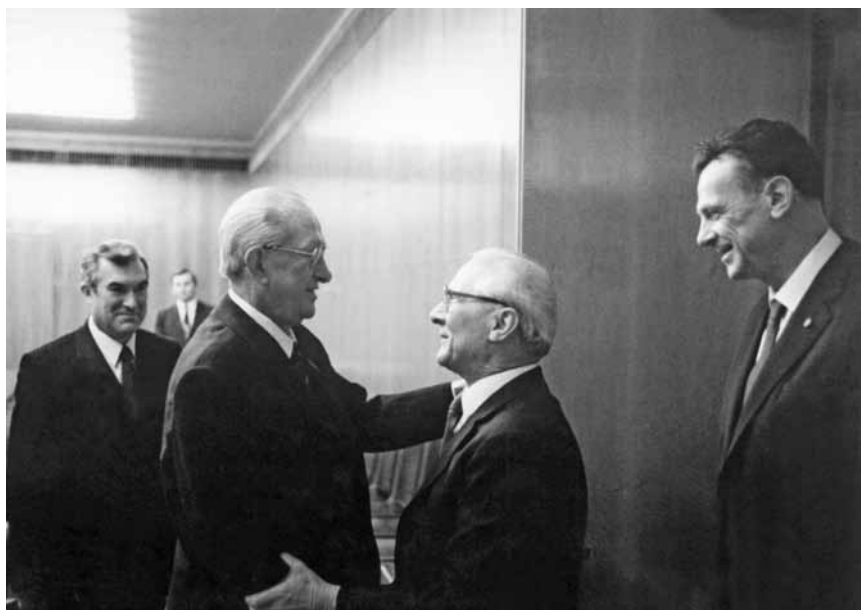
Встреча с Генеральным секретарем ЦК СЕПГ, Председателем Государственного Совета ГДР Э. Хонеккером. 20 декабря 1982 г.