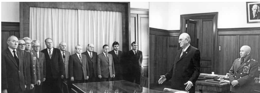
Ю. В. Андропов прощается в своем кабинете на Лубянке с руководством КГБ. Он переходит на Старую площадь в связи с избранием на пост Секретаря ЦК КПСС по идеологии. Москва, май 1982 г.