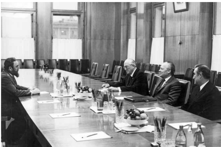
Встреча в Кремле с Первым секретарем ЦК Компартии Кубы, Председателем Государственного Совета и Советом Министров Республики Куба Фиделем Кастро Рус. Москва, 16 ноября 1982 г.