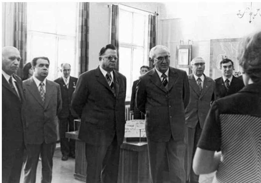
Ленинград, «Смольный». Август 1978 г.