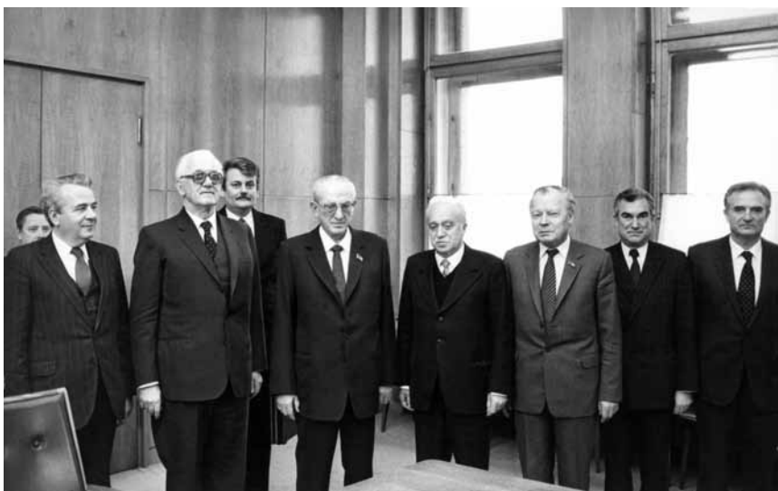
Встреча с Председателем Президиума СФРЮ П. Стамболичем и Председателем Президиума ЦК СКЮ М. Рябичичем. Москва, 16 ноября 1982 г.