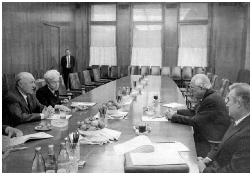
Встреча с Первым секретарем ЦК ВСРП Я. Кадаром. 20 декабря 1982 г.