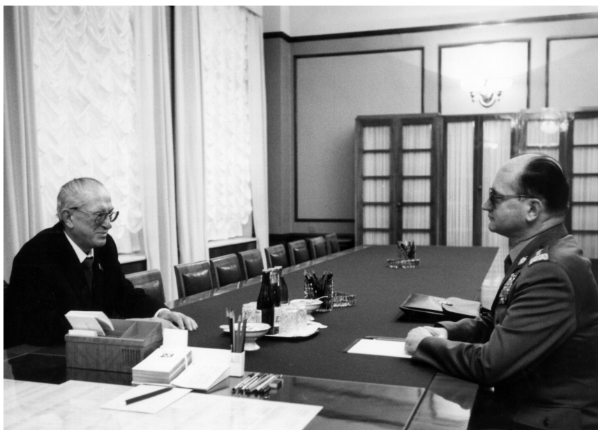
Встреча в Кремле с Первым секретарем Польской объединенной рабочей партии, Премьер-министром Польской Народной Республики В. Ярузельским. Москва, 23 декабря 1982 г.