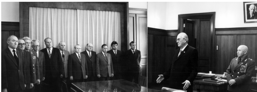
Ю.В. Андропов прощается в своем кабинете на Лубянке с руководством КГБ. Он переходит на Старую площадь в связи с избранием на пост Секретаря ЦК КПСС по идеологии. Москва, май 1982 г.