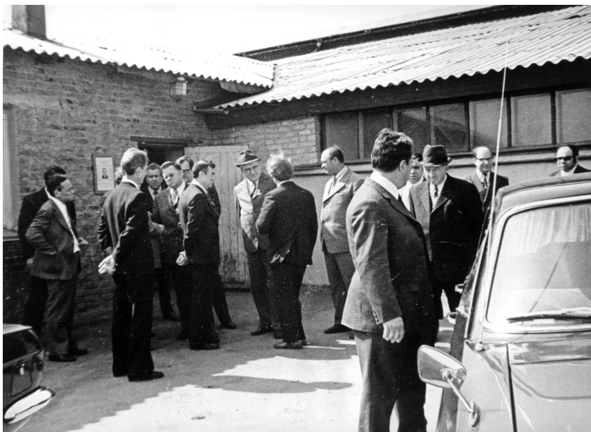
Тульская область, Каширский район. Июнь 1975 г.