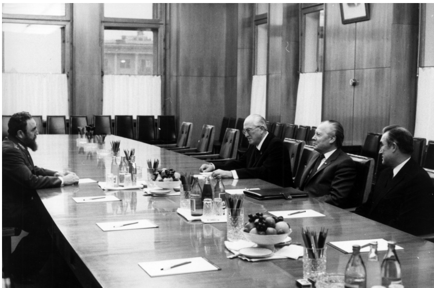
Встреча в Кремле с Первым секретарем ЦК Компартии Кубы, Председателем Государственного Совета и Совета Министров Республики Куба Фиделем Кастро Рус. Москва, 16 ноября 1982 г.