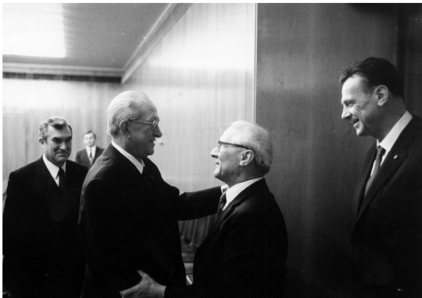
Встреча с Генеральным секретарем ЦК СЕПГ, Председателем Государственного Совета ГДР Э.Хонеккером. 20 декабря 1982 г.