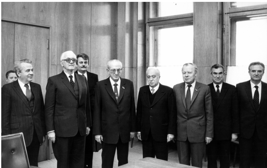
Встреча с Председателем Президиума СФРЮ П. Стамболичем и Председателем Президиума ЦК СКЮ М. Рябичичем. Москва, 16 ноября 1982 г.