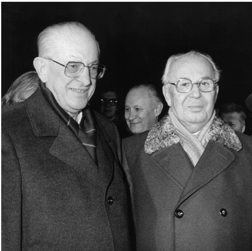
Президент Густав Гусак встречает на аэродроме Ю.В.Андропова. Прага, 4 января 1983 г.