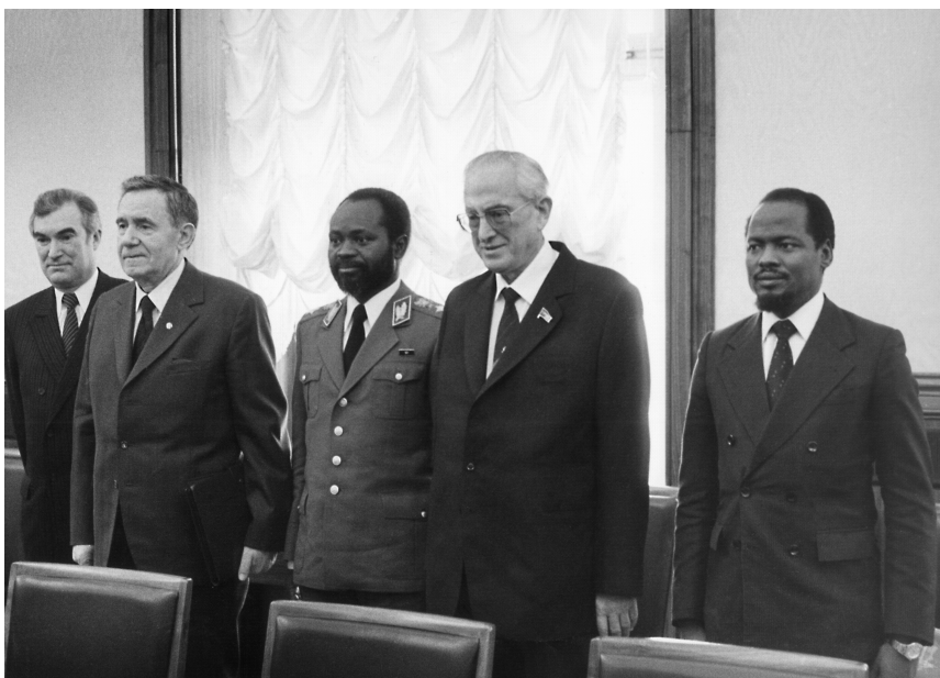
Встреча с Председателем партии Фрелимо, Президентом Народной Республики Мозамбик Саморой Машелом. Москва, Кремль, 2 марта 1983 г.