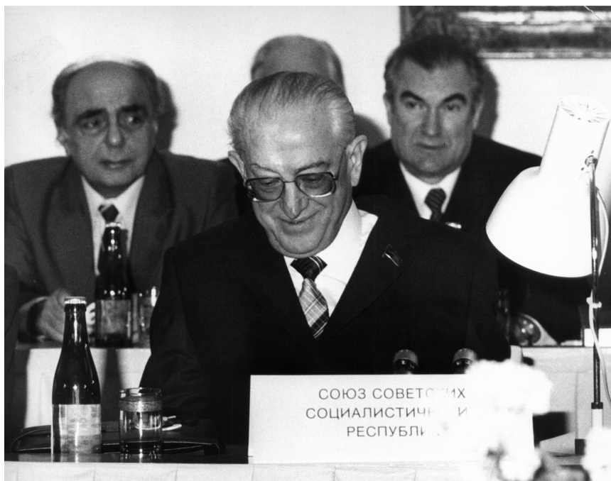
Совещание Политического Консультативного Комитета государств-участников Варшавского Договора. Прага, 4 января 1983 г.