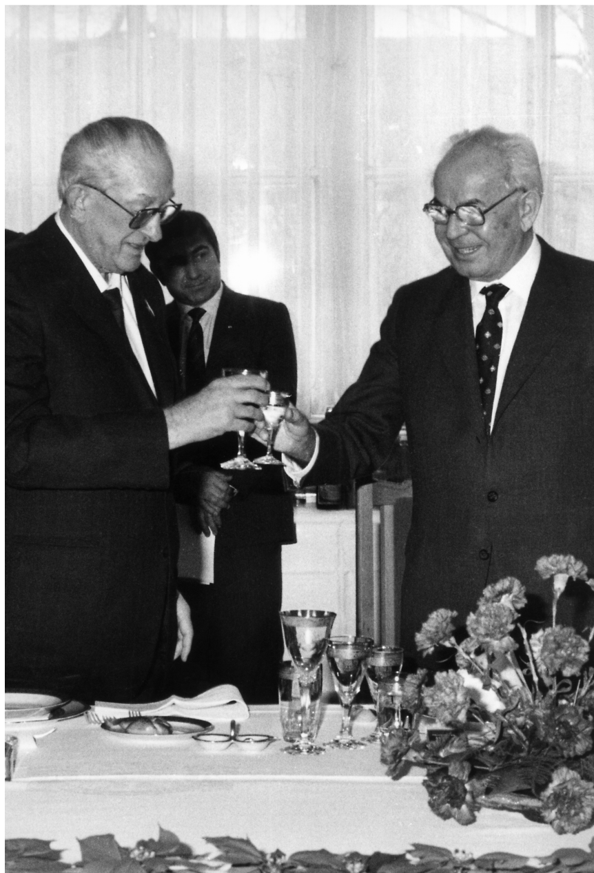
С Густавом Гусаком во время совещания ПКК. Январь, 1983 г.