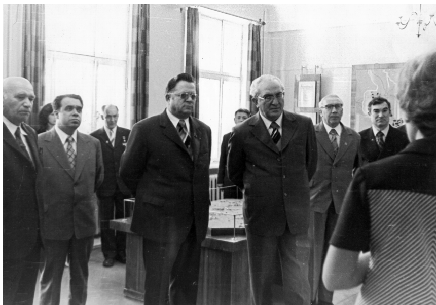
Ленинград, «Смольный». Август 1978 г.