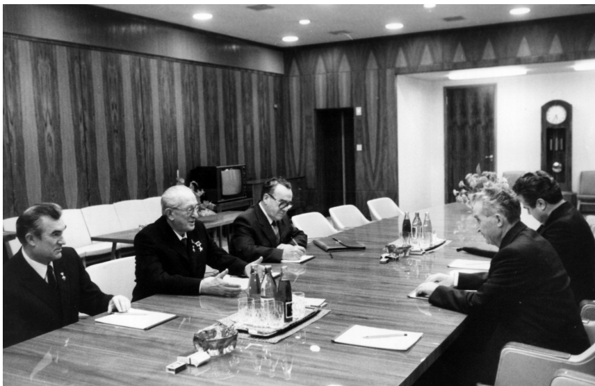
Встреча в Кремле с Генеральным секретарем ЦК Румынской Компартии, Президентом СРР Н. Чаушеску. Москва, 21 декабря 1982 г.