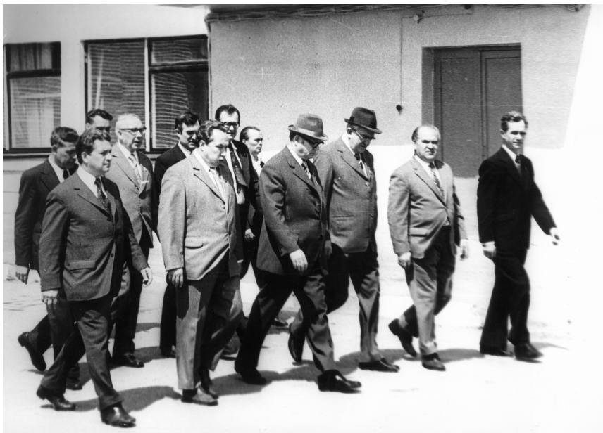
Тульская область, Каширский район. Июнь 1975 г.