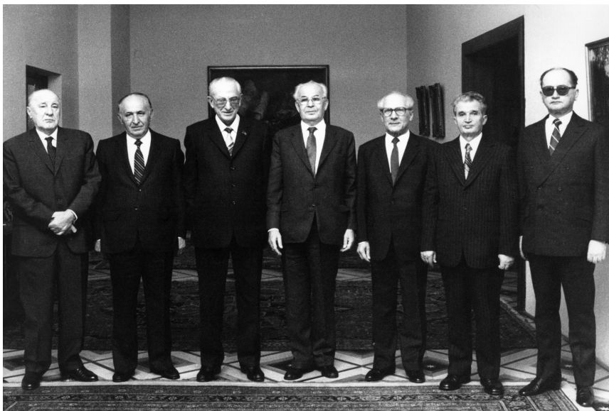
Главы делегаций на совещании Политического Консультативного Комитета государств-участников Варшавского договора. Янош Кадар (Венгрия), Тодор Живков (Болгария), Юрий Андропов (СССР), Густав Гусак (Чехословакия), Эрих Хонеккер (ГДР), Николае Чаушеску (Румыния), Войцех Ярузельский (Польша). Прага, январь 1983 г.