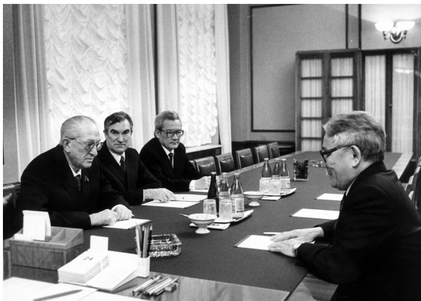
Встреча в Кремле с Генеральным секретарем ЦК Монгольской народно-революционной партии, Председателем Великого народного хурала МНР, Ю.Цеденбалом. Москва, 24 декабря 1982 г.