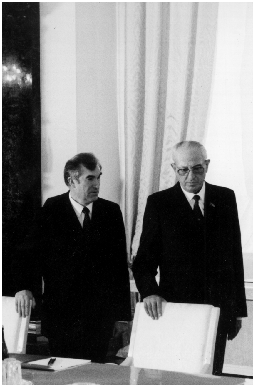
Ю.В.Андропов со своим помощником В.В.Шараповым перед встречей с зарубежной делегацией. Осень 1982 г.